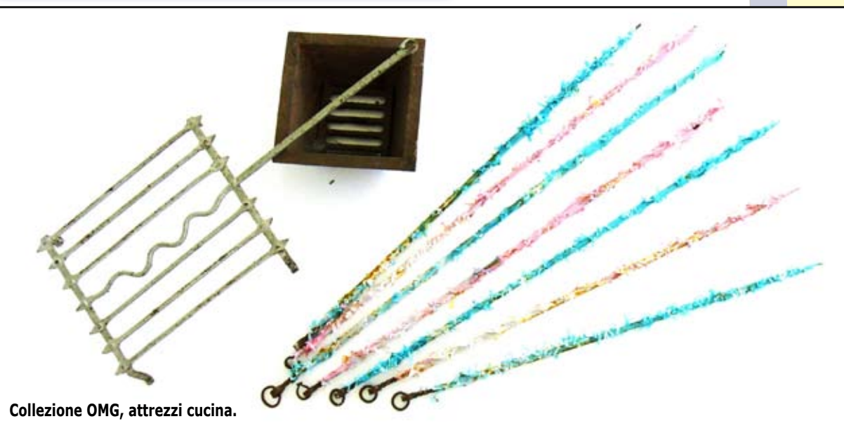
Collezione OMG, attrezzi cucina.